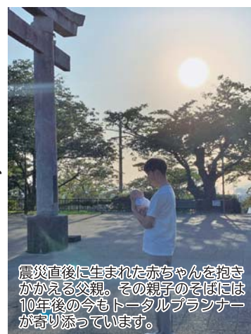
震災直後に生まれた赤ちゃんを抱きかかえる父親。その親子のそばには10年後の今もトータルプランナーが寄り添っています。

日本に住む私たちにとって地震はいつでもどこで発生してもおかしくありません。災害が起きる前の備えとして何ができるか、いざ災害が発生したときはどのような行動をとるべきか、一人ひとりが考えなければいけません。