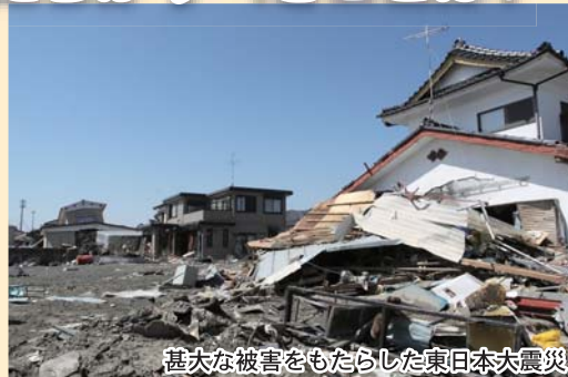
甚大な被害をもたらした東日本大震災

未曾有の被害をもたらした東日本大震災。今年3月で10年が経ちます。震災関連死を含む死者・行方不明者数は2万2,000人を超え、今もなお、プレハブの仮設住宅での暮らしを余儀なくされる人たちがいます。私たちは、この大震災を教訓に、防災・減災への意識を高めていかなければいけません。